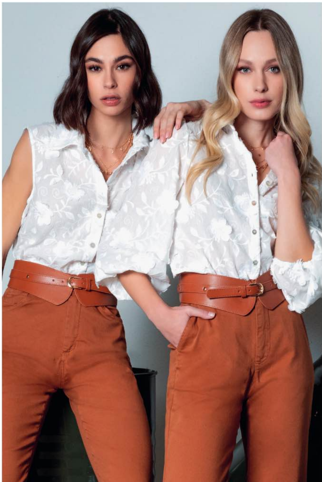
a sinistra - top CESTO, pantalone PENNY a destra - camicia CIAMBELLA, pantalone PORTO