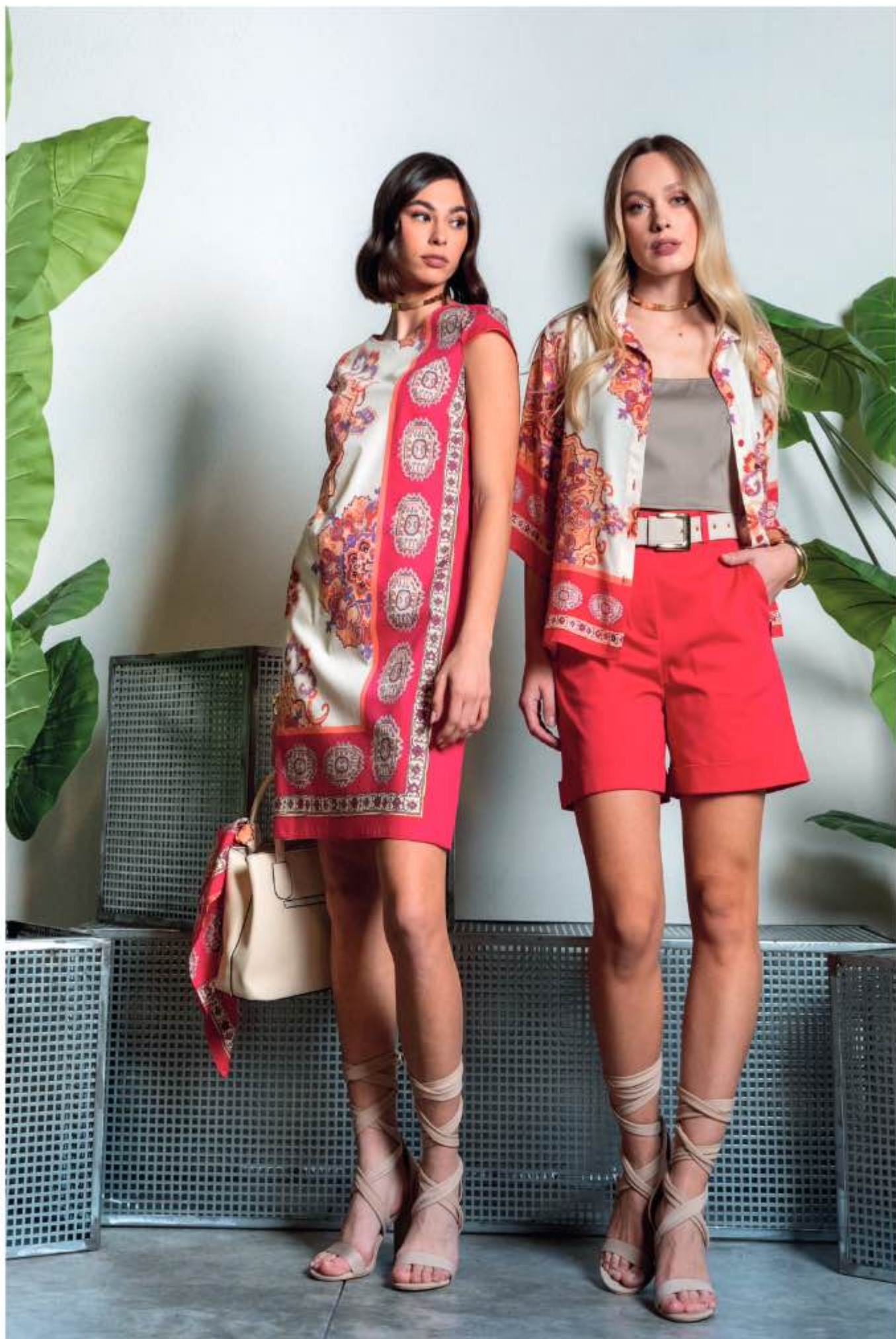
38 a sinistra - abito STEVEN a destra - camicia SOIA, top ROVO, shorts RAFFAELLO