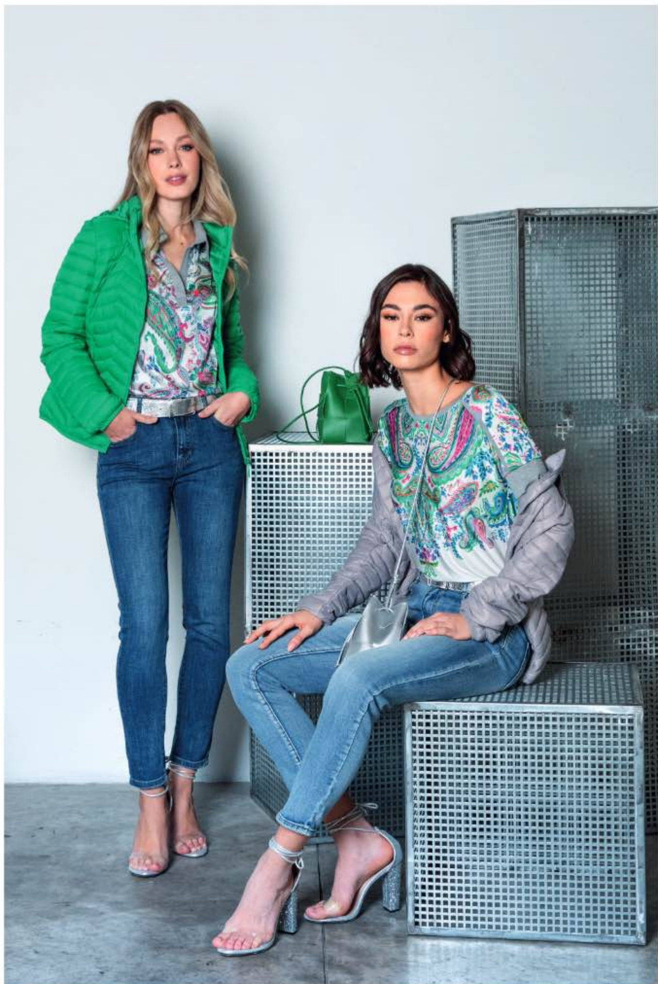
a sinistra - piumino PALINURO, polo STORIA, jeans DALLAS a destra - piumino PALINURO, maglia SALVO, jeans DALLAS