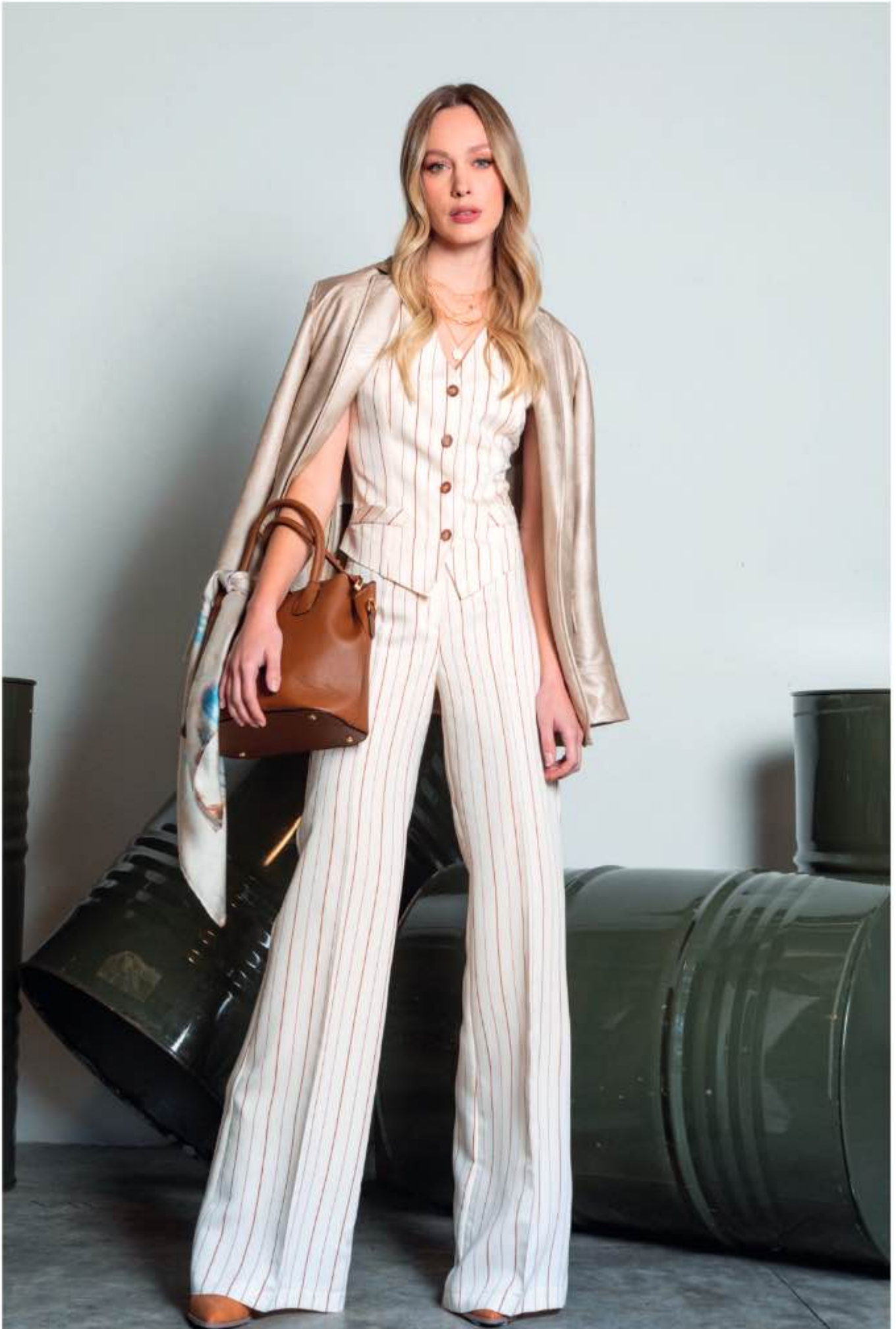
blazer ELETTRA, gilet VARESE, pantalone VANDA