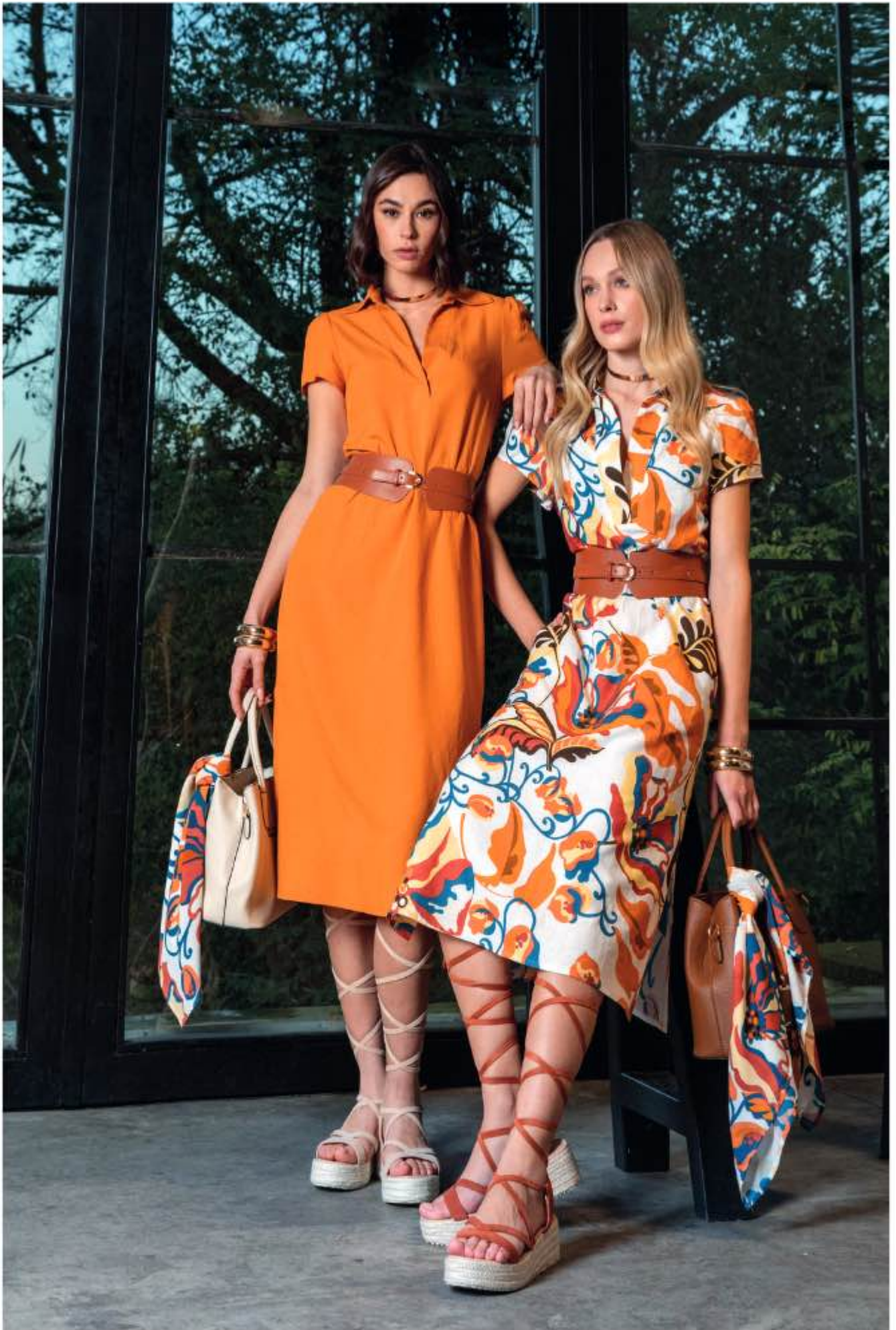
a sinistra - abito LITRO a destra - abito SERGIO