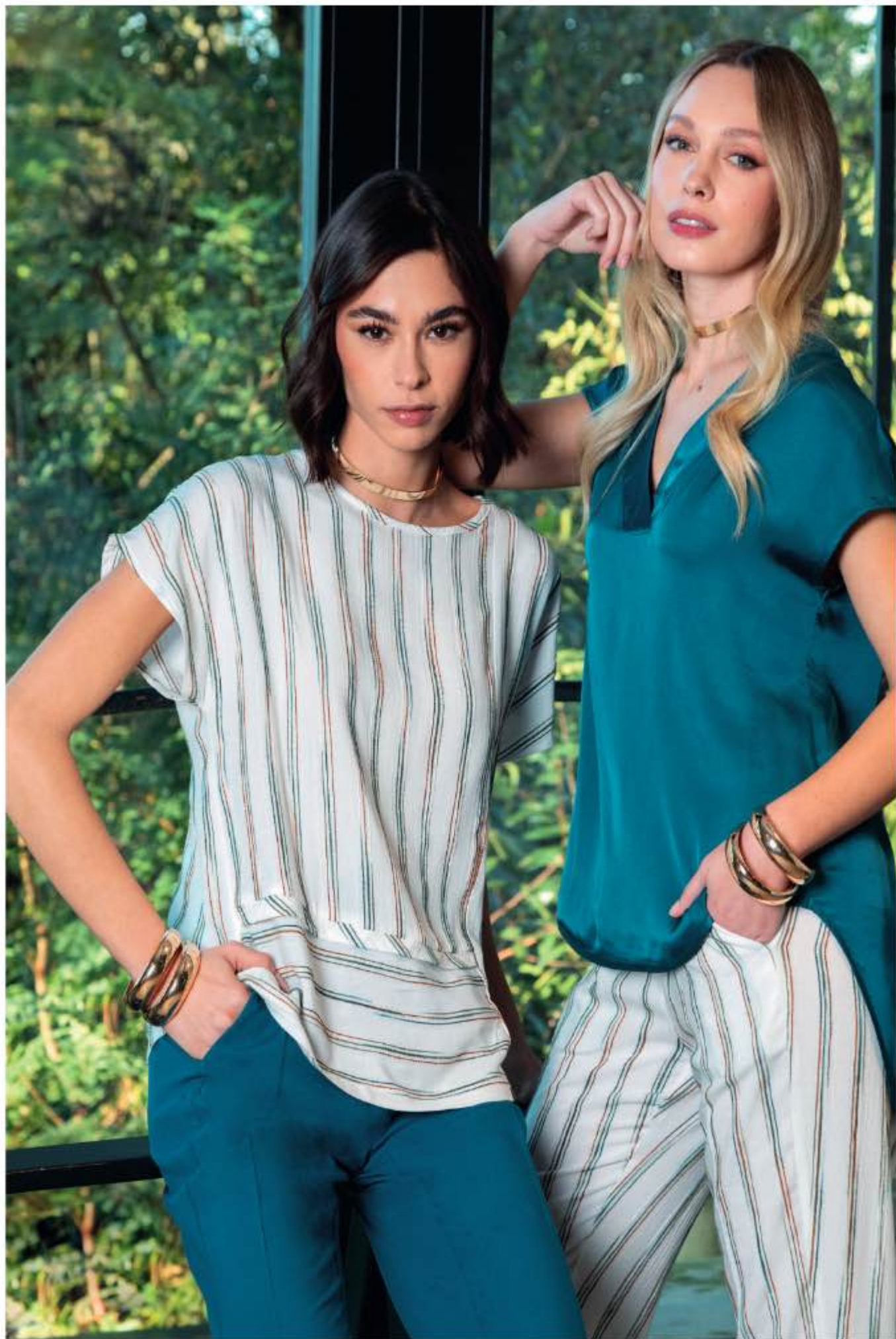
a sinistra - casacca VERBENA, pantalone LILIUM a destra - casacca VETTA, pantalone VELIERO