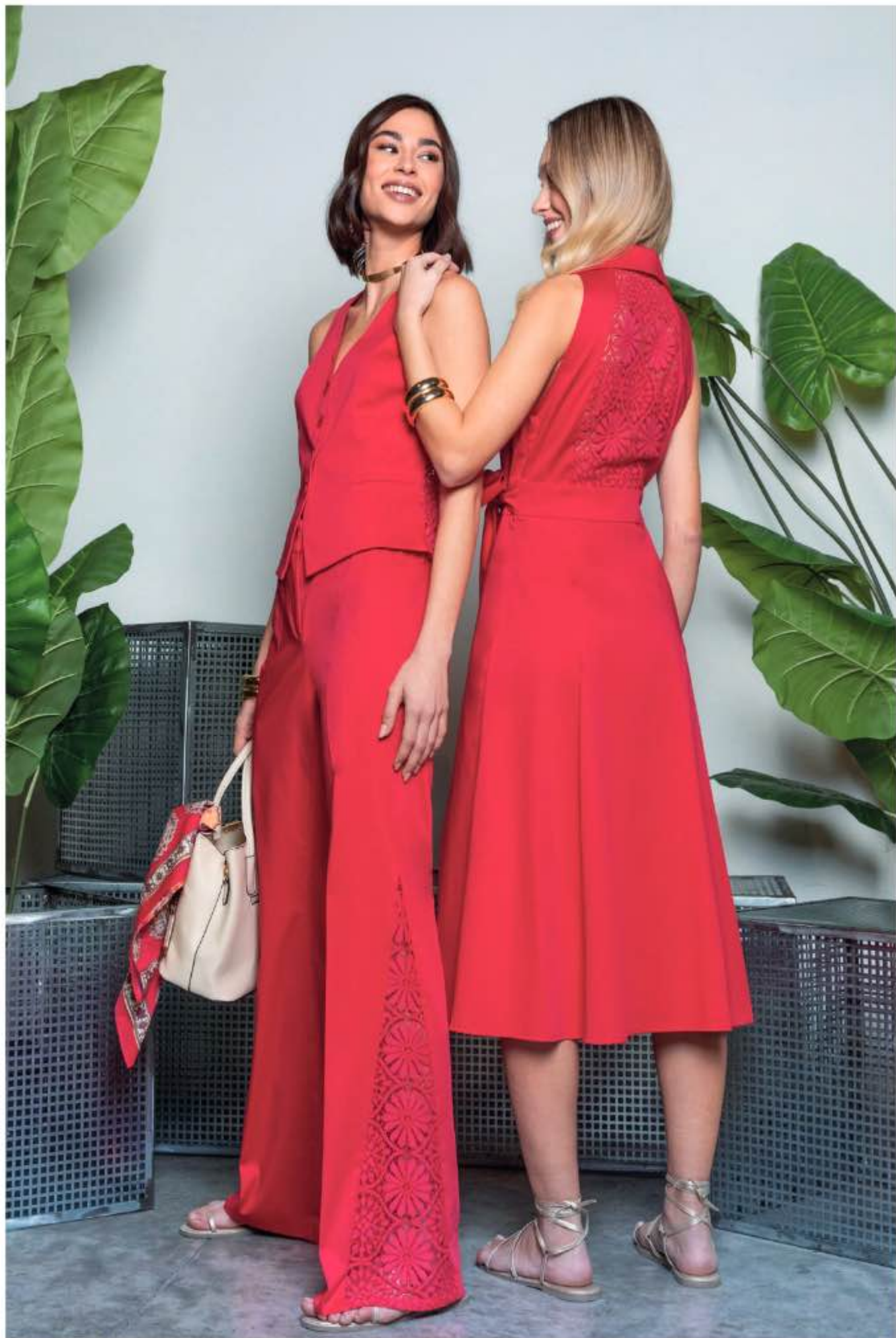
36 a sinistra - gilet ROSALBA, pantalone RUDY a destra - abito RADIO