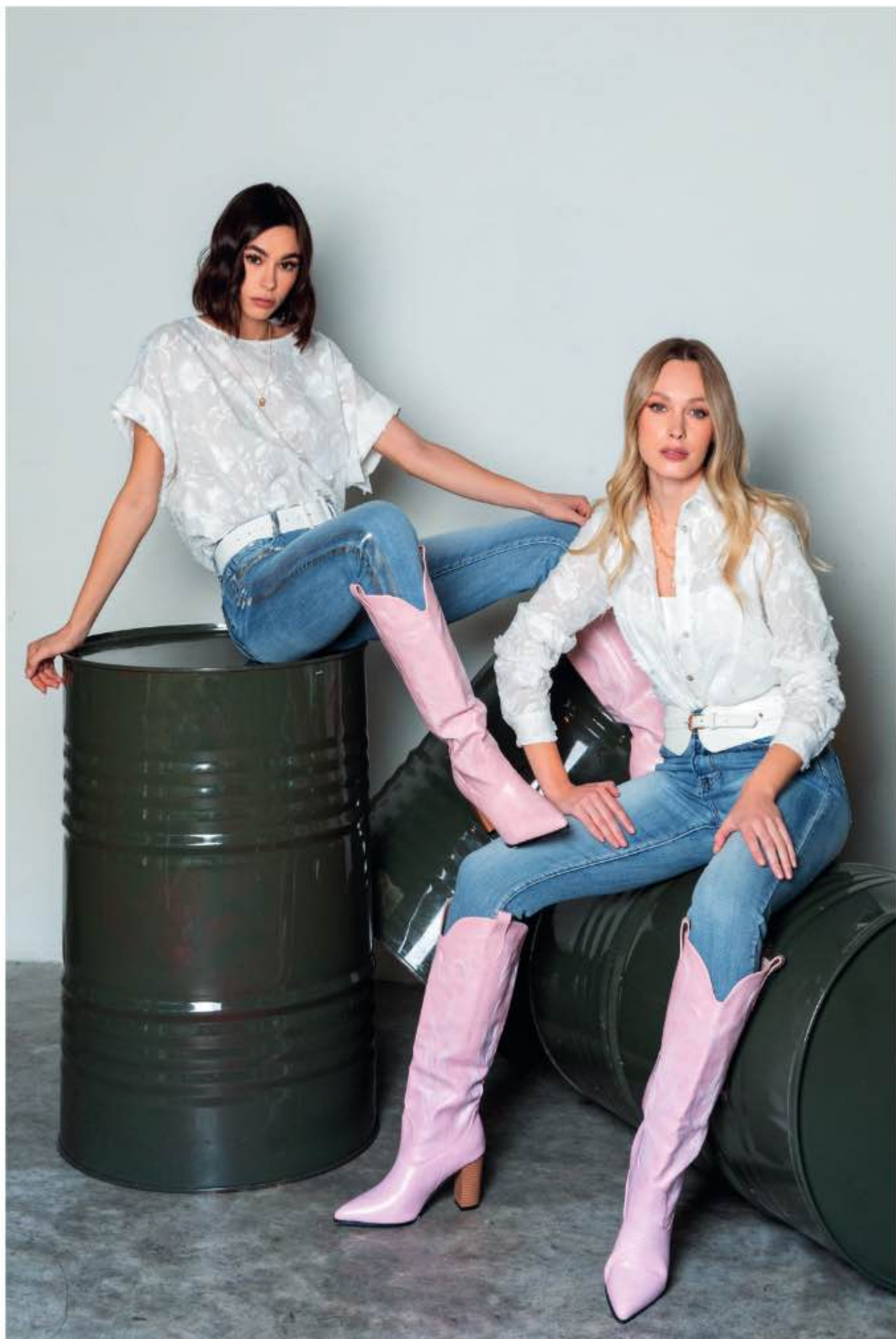
a sinistra - casacca CAMILLA, jeans DUSTIN a destra - camicia CASA, top ROVO, jeans DALLAS