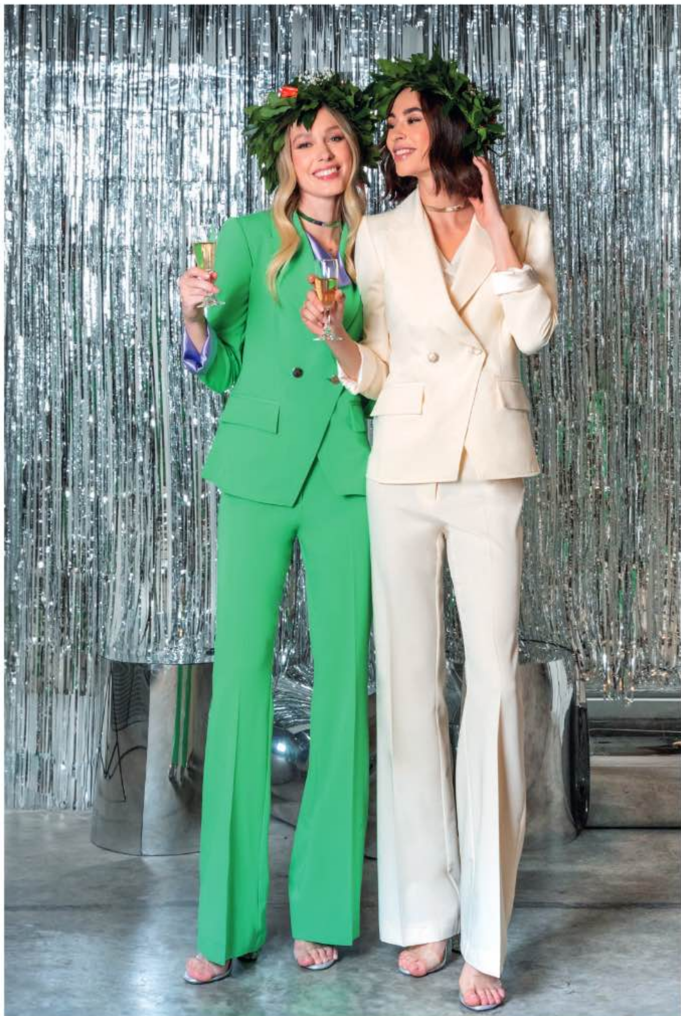
a sinistra - tailleur TUFFO, top TASSO a destra - tailleur TROPEZ, top TASSO