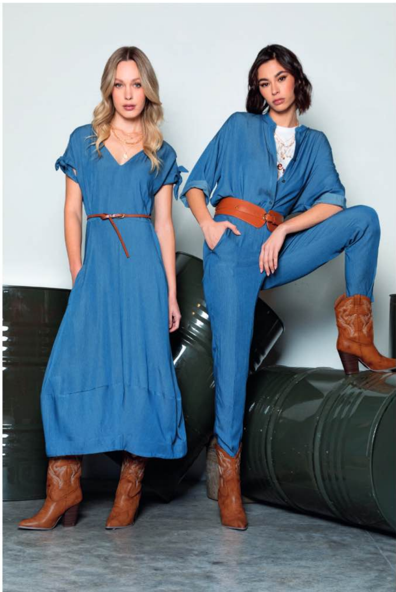
22 a sinistra - abito TOMMASO a destra - camicia TOSCANA, t-shirt TIZIANO, pantalone TROFEO