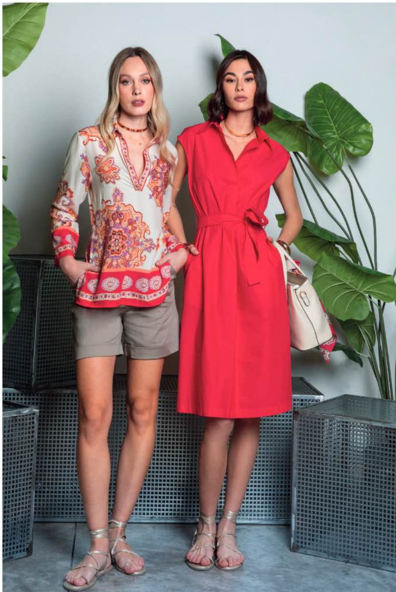
42 a sinistra - polo SMART, shorts RAFFAELLO a destra - abito TESSA