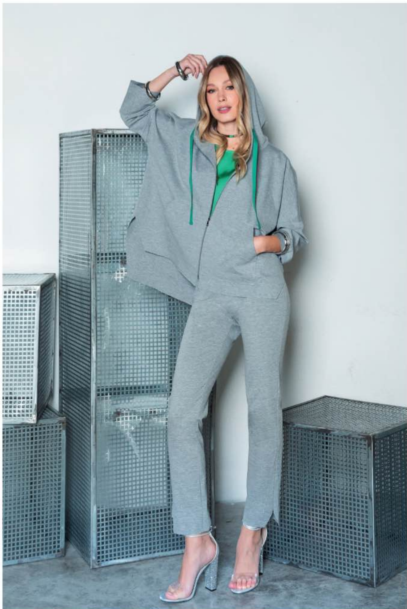
4 felpa PAPIRO, casacca VERA, pantalone PETUNIA