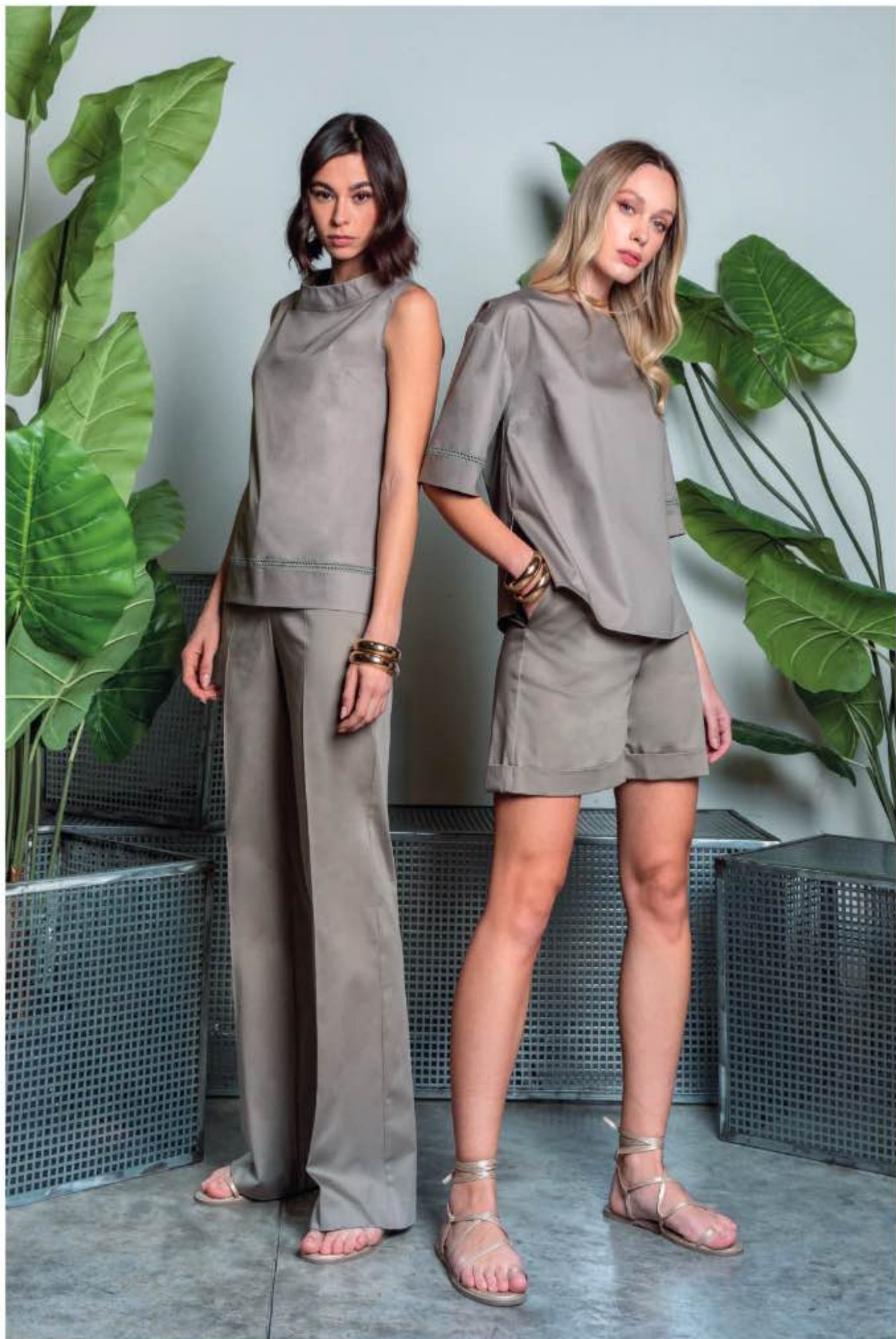
a sinistra - top TELEFONO, pantalone RADURA a destra - casacca TOLOSA, shorts RAFFAELLO