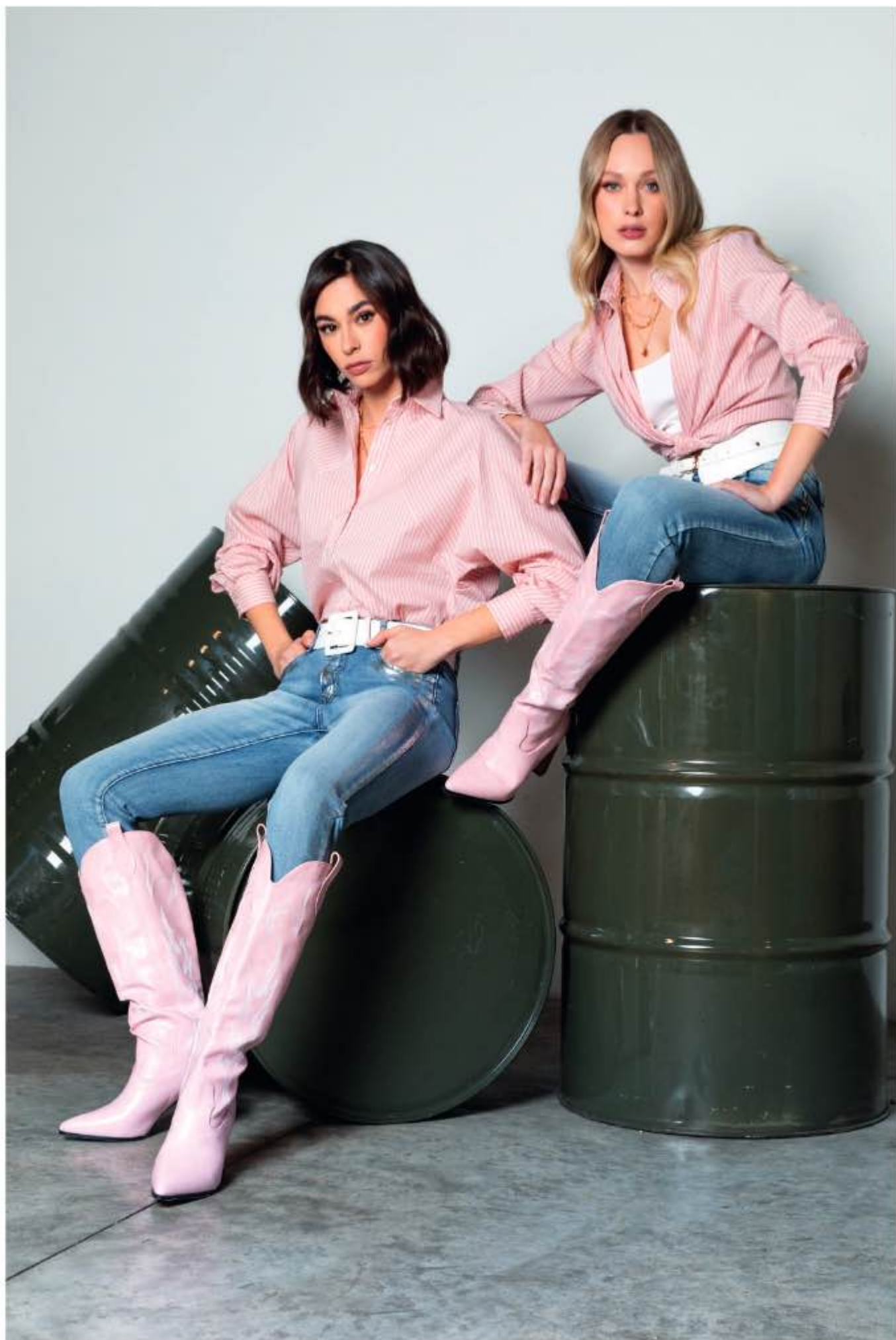
26 a sinistra - camicia PINKY, jeans DUSTIN a destra - camicia PEONIA, top ROVO, jeans DALLAS