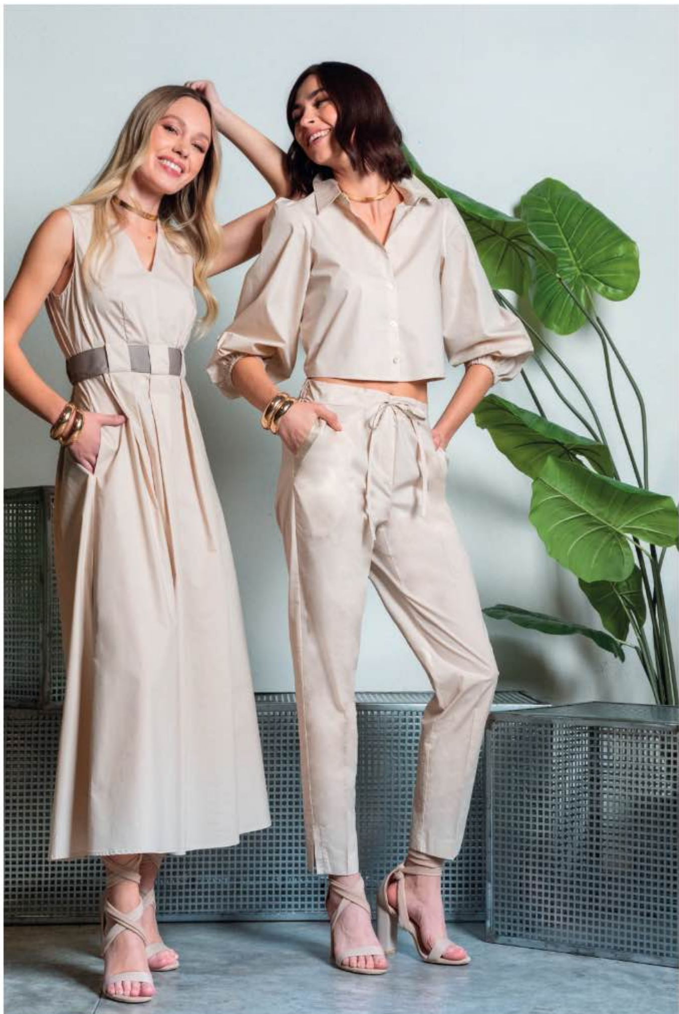
a sinistra - abito TAZIO a destra - camicia TOGO, pantalone TERESA