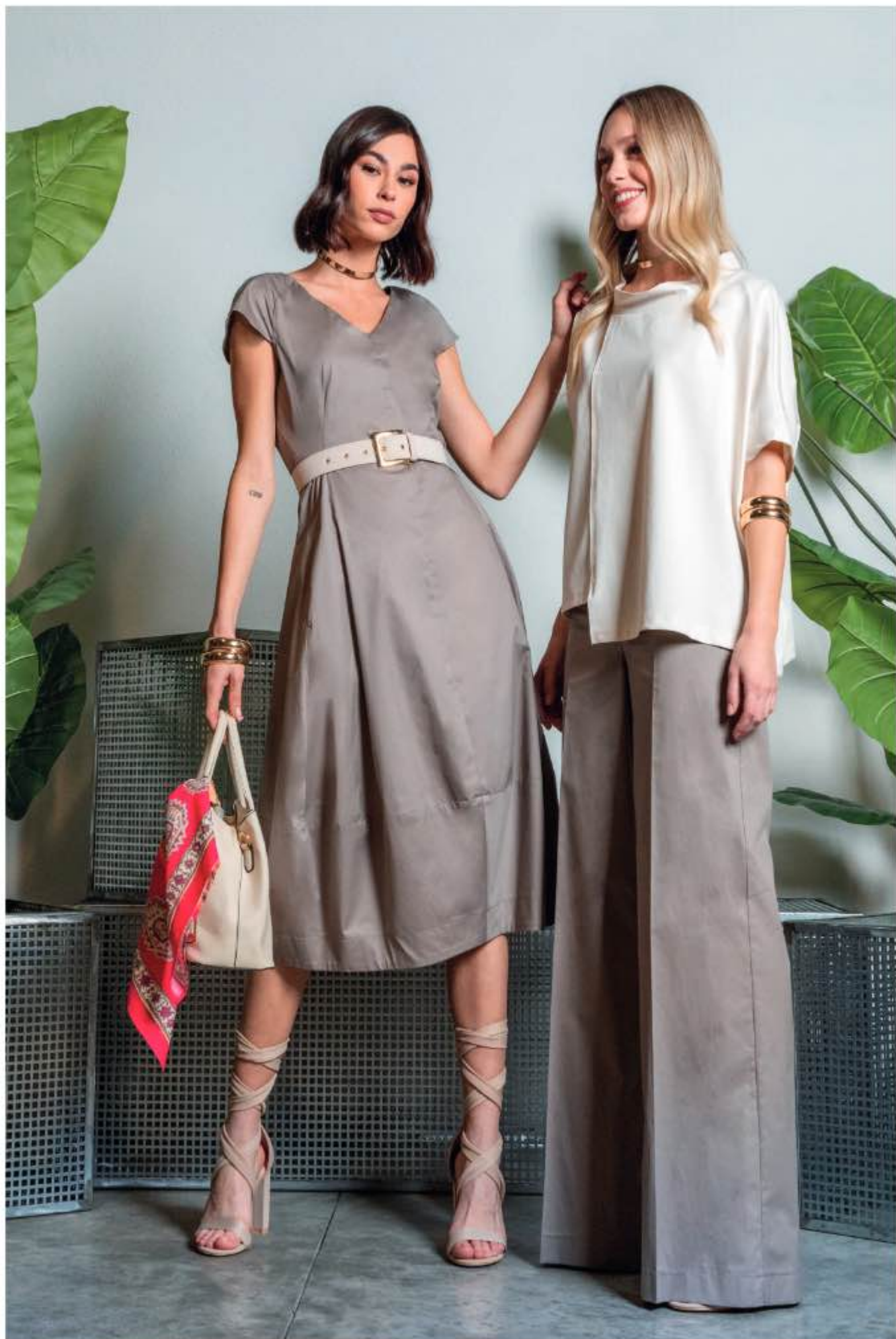
48 a sinistra - abito TIGLIO a destra - maglia MORA, pantalone TORINO