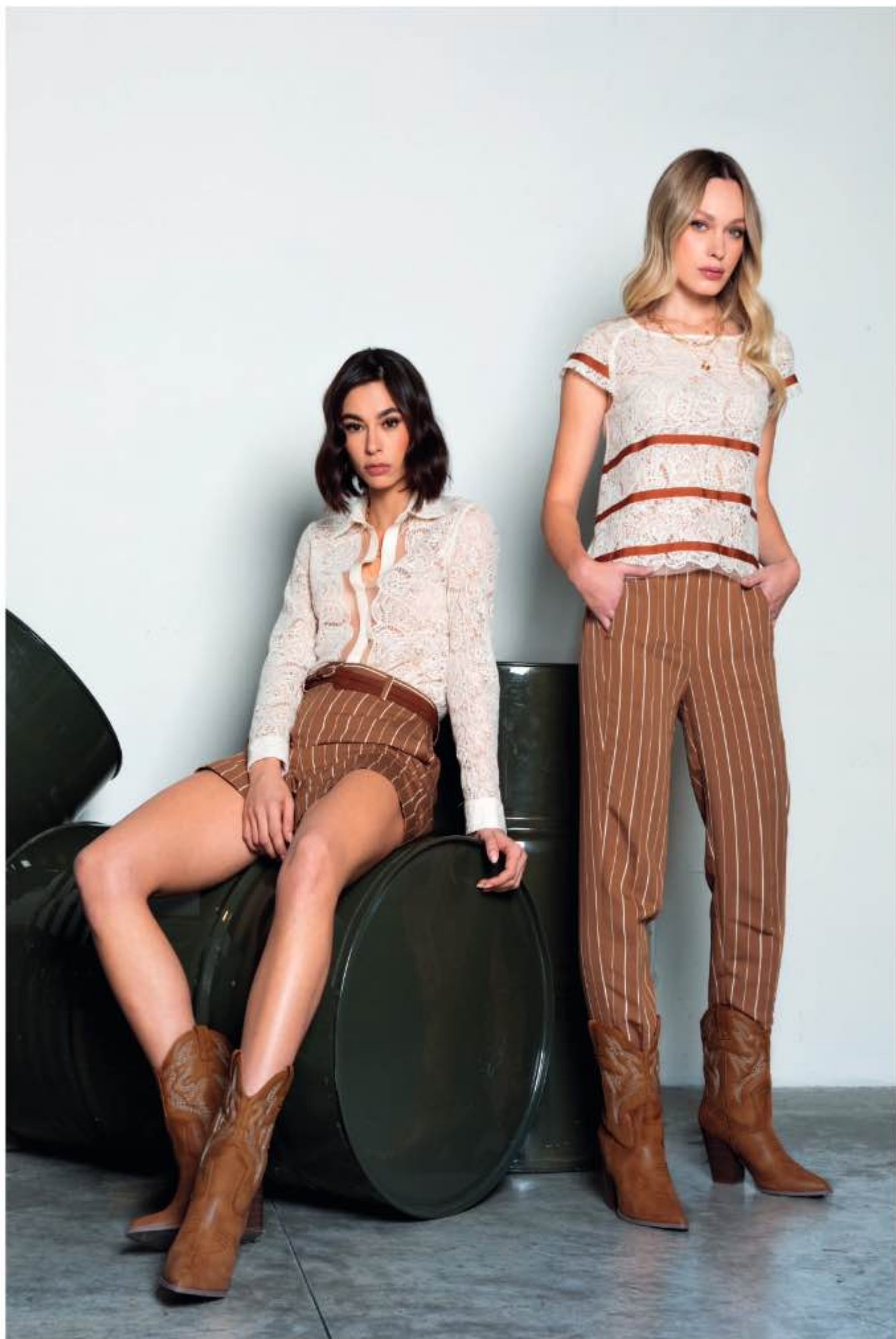
a sinistra - camicia PALOMA, shorts VEGA a destra - top POLLY, pantalone VULCANO