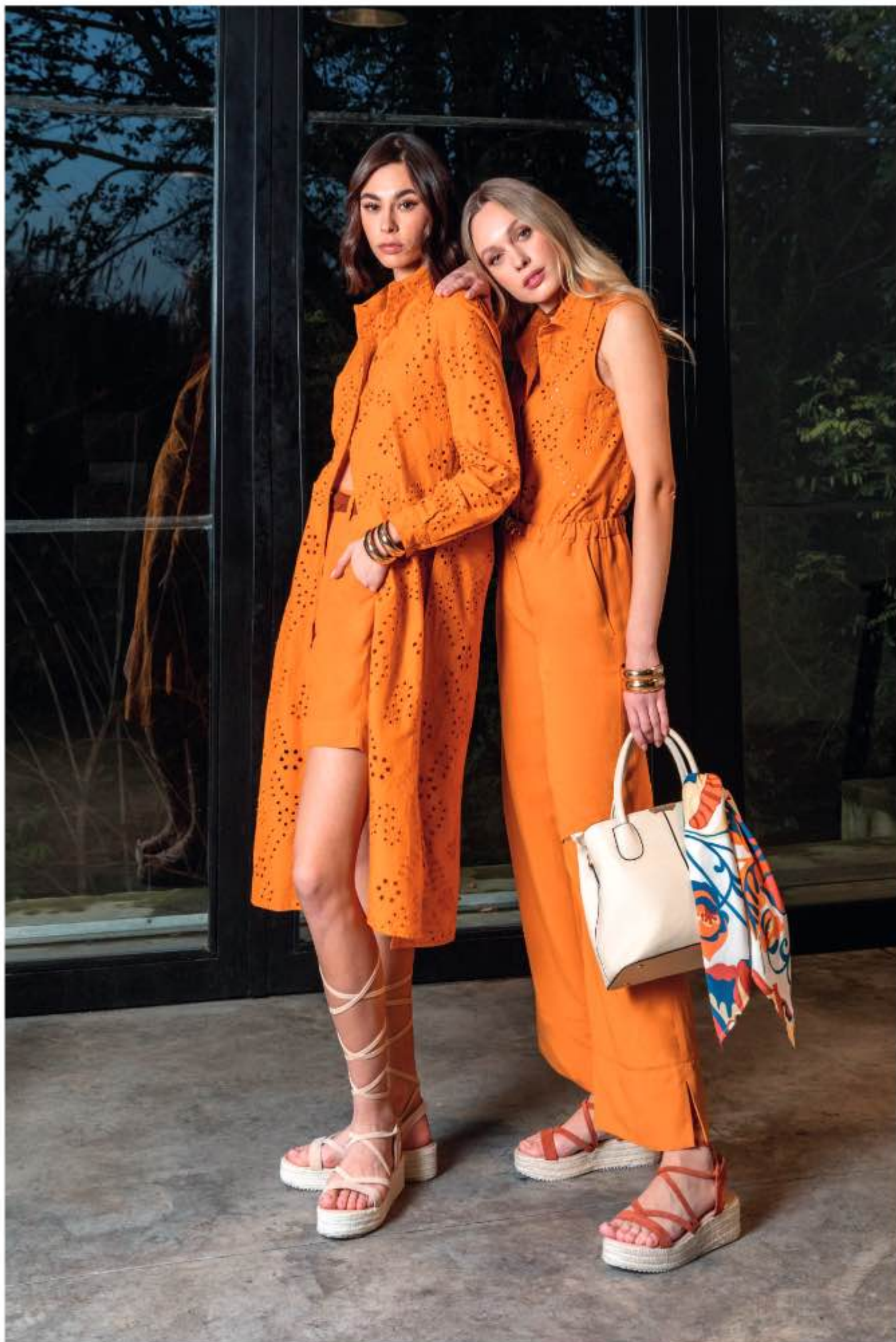
a sinistra - camicione STRADA, shorts LARA 59 a destra - top SIGARO, pantalone LUKE