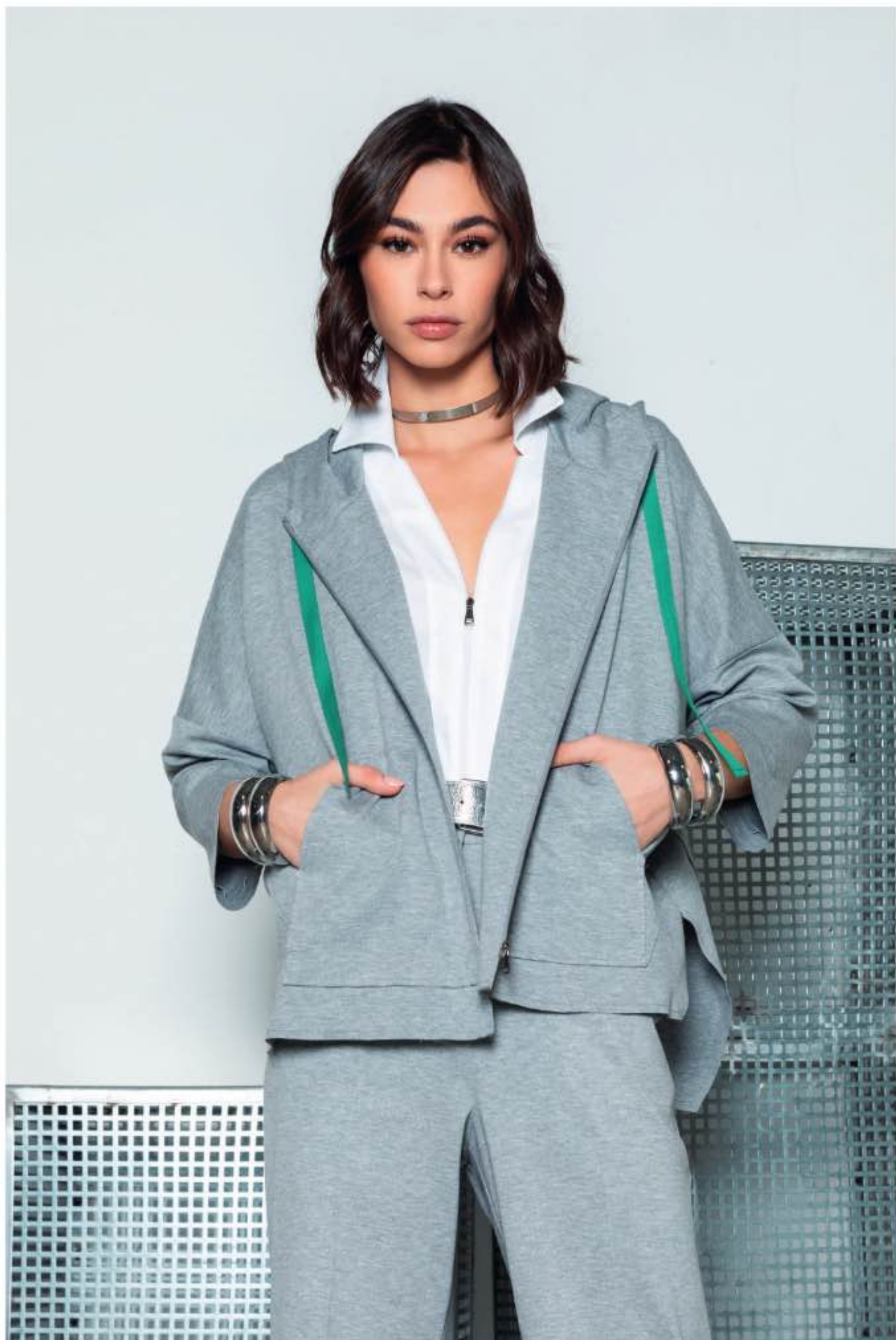
8 felpa PAPIRO, camicia PEDRO, pantalone PRIMULA