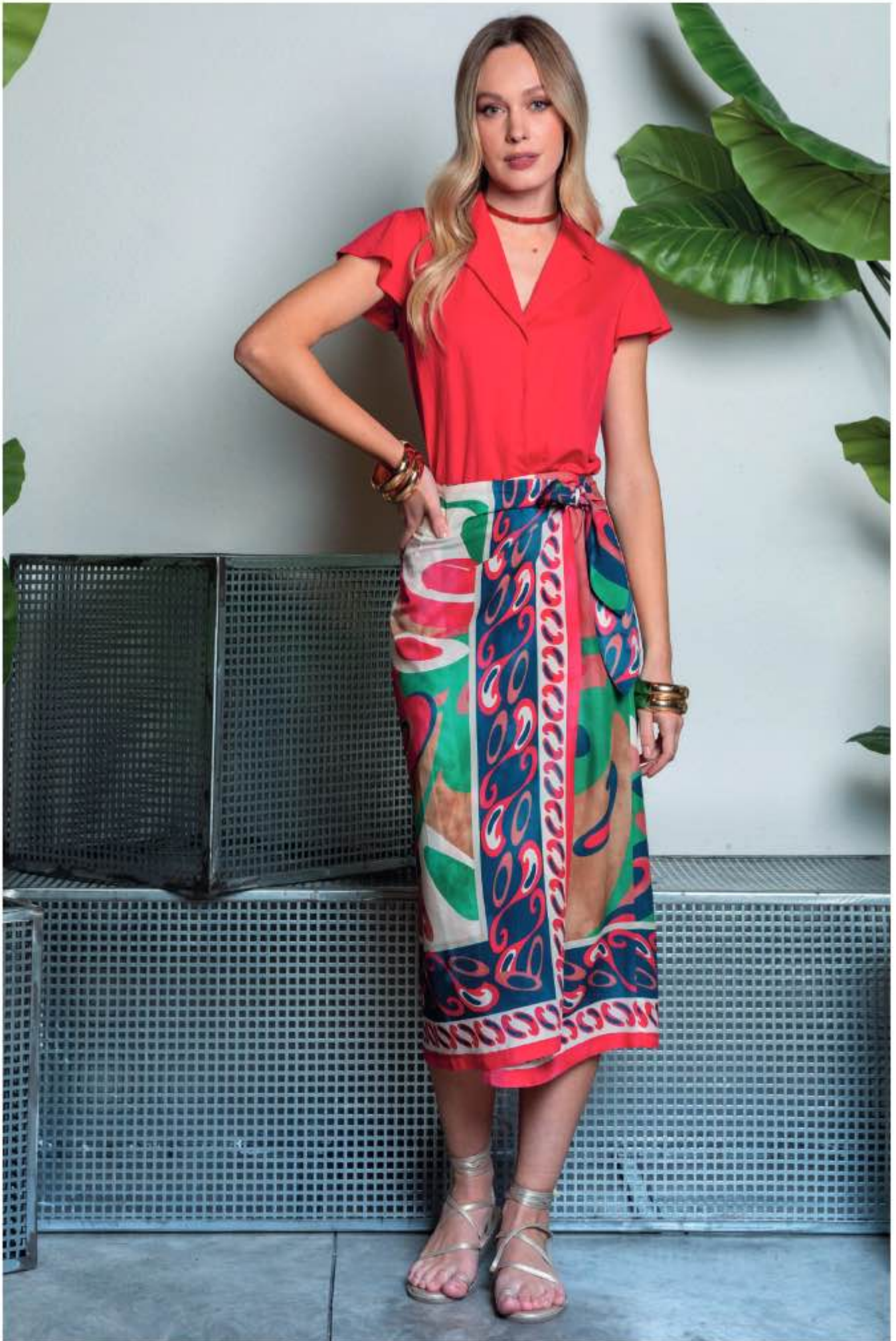
50 camicia JACK, gonna SIAMESE