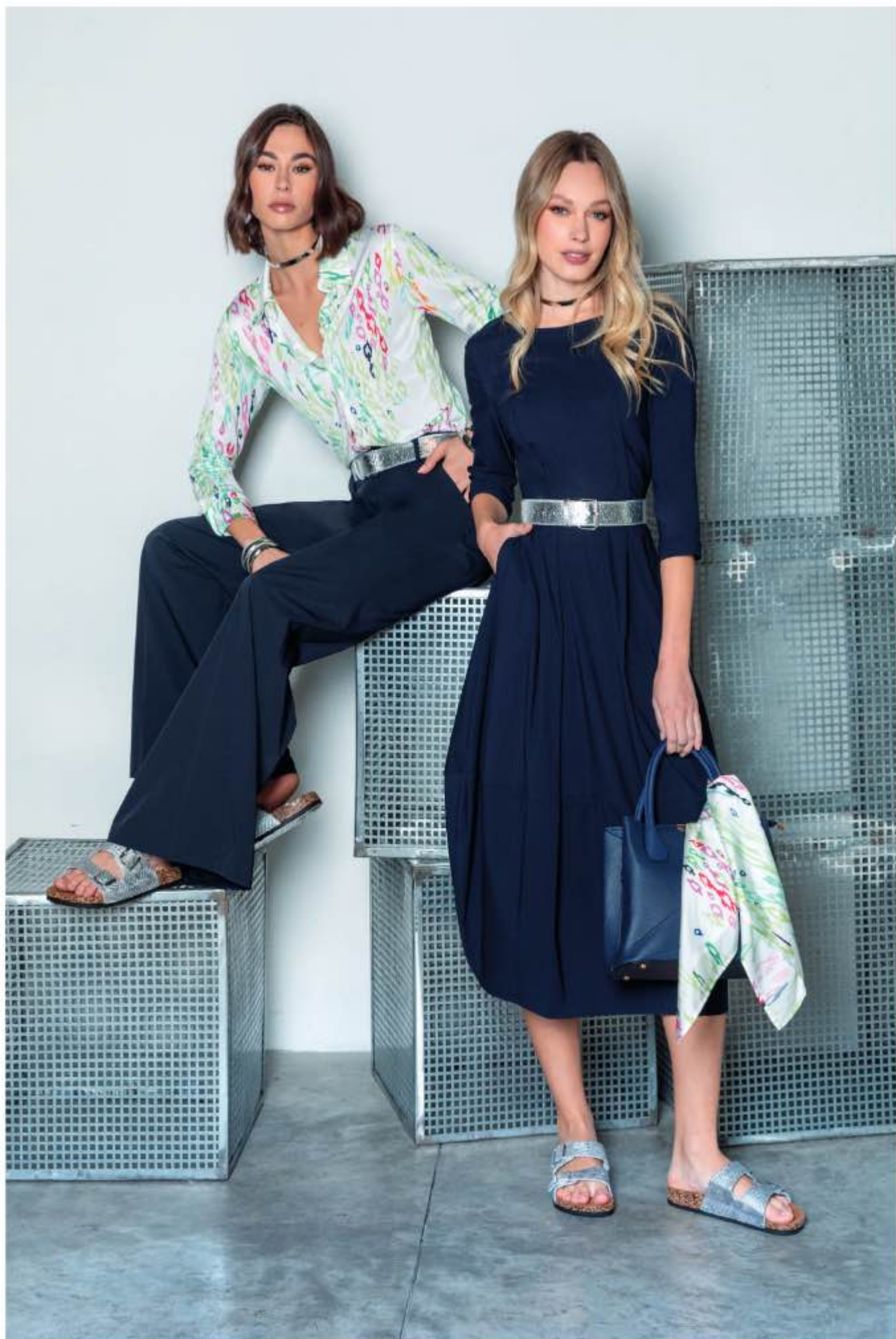
a sinistra - camicia SILVESTRO, pantalone BOGOTA a destra - abito BASILICA