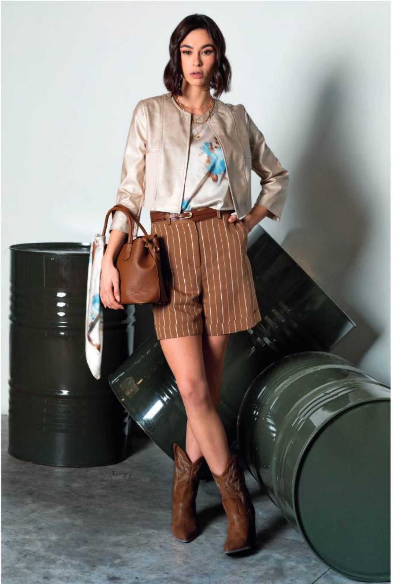
giacca ELISA, top STEFY, shorts VEGA