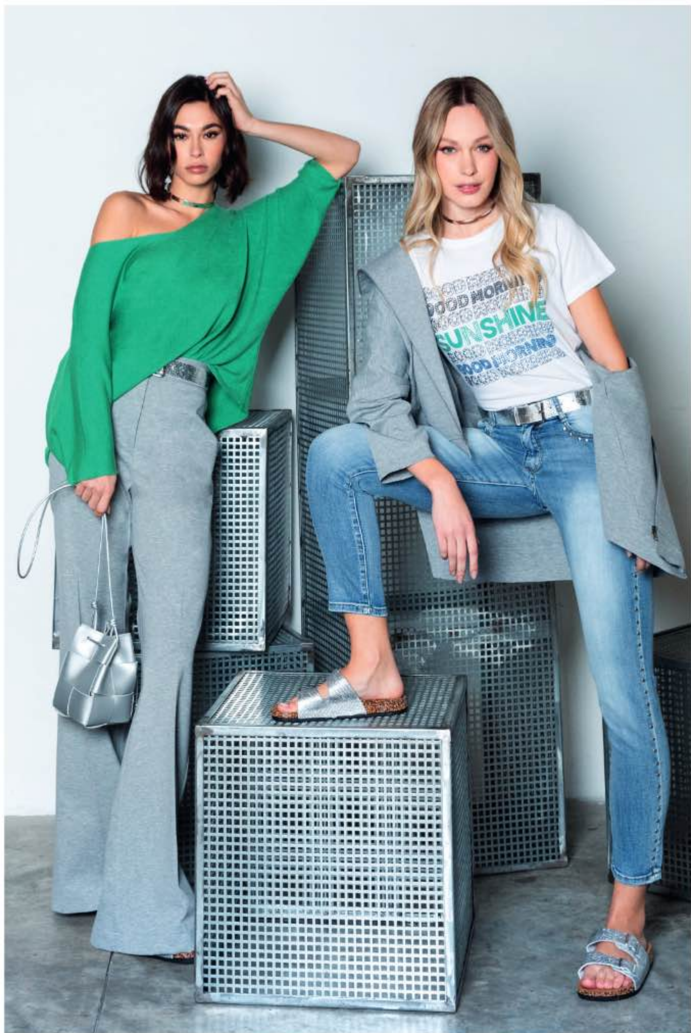
a sinistra - maglia MATILDE, pantalone PRIMULA a destra - felpa PAPIRO, t-shirt TONY, jeans DONATA