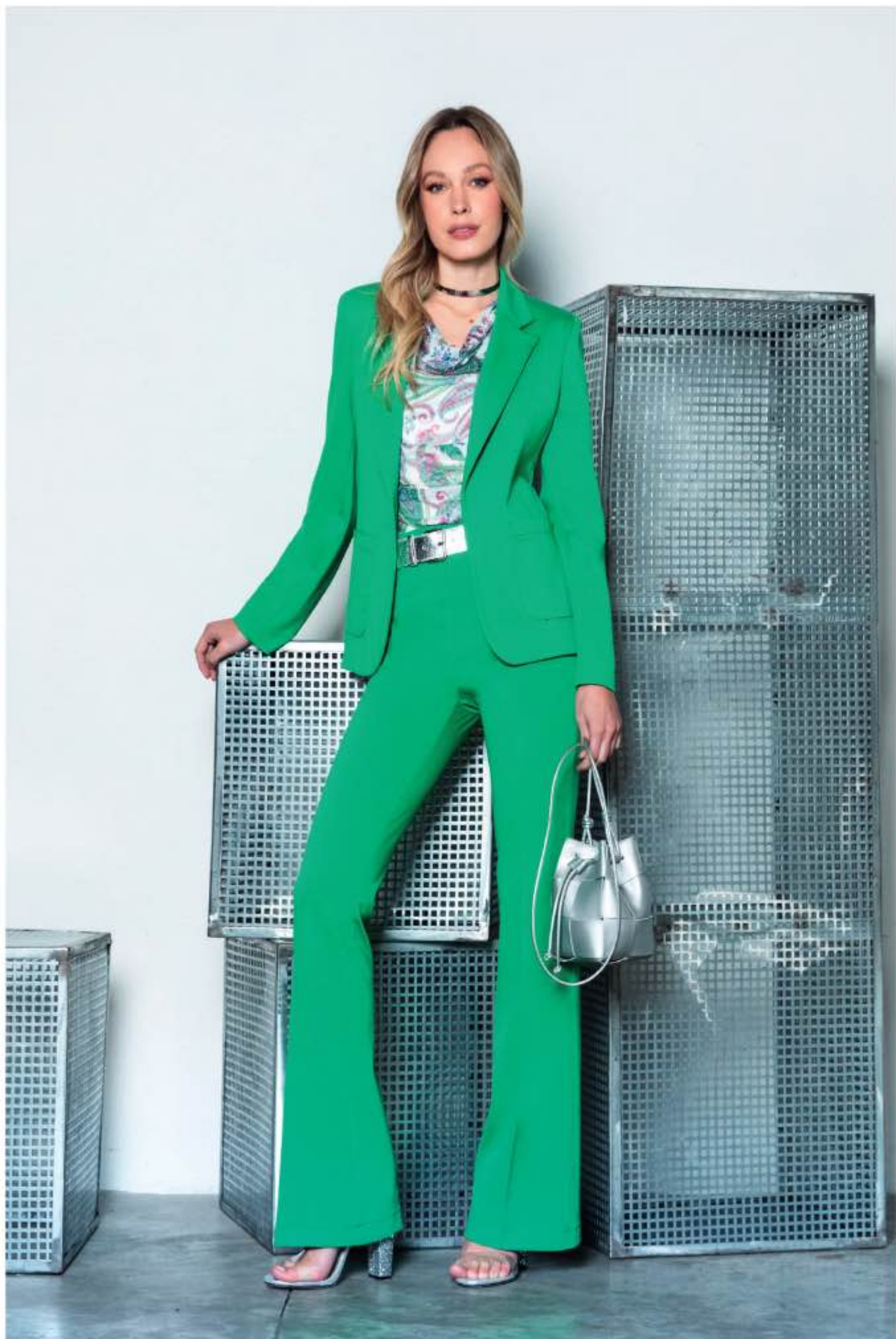
giacca PAPRIKA, maglia SCALA, pantalone PONZA